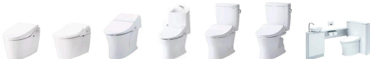
新ネオレストAH (壁排水)

TOTOの超節水トイレは、大洗浄13Lから4.8Lへ、 小洗浄が3.6L、ECO小なら3.4Lとさらに節水